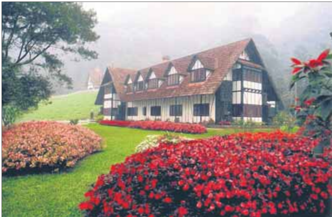
发思古之幽情： 古色古香的The Lakehouse酒店，其实是两座黑白建筑，一高一低屹立在一个小山头上。