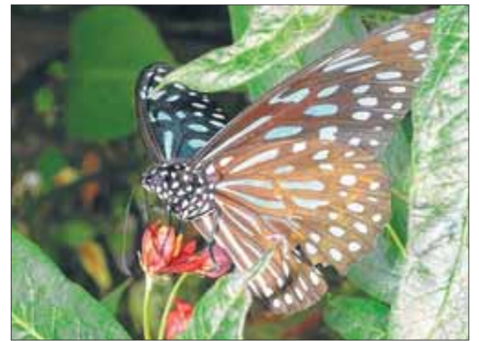
一应俱全： Brinchang镇上有自己的草莓园、仙人掌园、菜园，距离不是很远，尤其适合家庭游客。