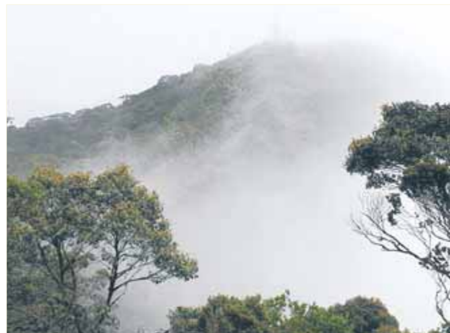
居高临下： Gunung Brinchang是金马仑最高峰，海拔2032m。

苔藓林向来是金马仑的一大卖点，却因为山中泥路难行，让都市人望而却步。幸运的是，数个月前开始修了一条森林步道，入口就在Gunung Brinchang半山处。在超过200m的步道轻松步行，树木中透入丝丝光线，空气中都是植物的味道。木板道尽头有块石碑，标示着彭亨州与霹靂州的交界。登山者由此一路进入，可以通往Gunung Irau。